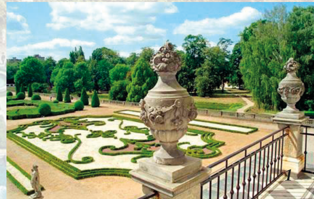
Pałac Branickich w Białymstoku

Wzorce muzyczne, literackie, architektoniczne, modowe etc. czerpane bezpośrednio z dworu Ludwika XIV i jego otoczenia dosłownie rozlały się po całej Europie. Powstały setki pałaców z ogrodami w porządku francuskim, à la Wersal, zakładano orkiestry na wzór słynnej królewskiej orkiestry La chapel Royale, czerpano z dokonań literatury, teatru i muzyki francuskiej. Każdy, kto chciał być „trendy” przyjmował francuski styl ubierania się, czesania oraz obowiązkowo manieri i język francuski.