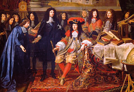
Ludwik XIV w otoczeniu członków akademii francuskiej

Ludwik XIV był założycielem wielkiej liczby akademii, stowarzyszeń mających na celu rozwój różnych dziedzin nauki i sztuki. Osobiście doglądał prac przy rozbudowie pałacu i ogrodów w Wersalu. Jego oczkiem w głowie był balet a ujmując szerzej- teatr, który w tamtym czasie był nierozdzielnie złączony z muzyką. W wielu sztukach teatralnych, król osobiście tańczył powierzone mu role.