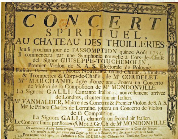
Program Le Concert Spirituel z 1754 r.