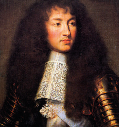
Ludwik XIV 1638-1715

Moda na francuszczyznę opanowała barokową Europę w związku z panowaniem na tronie Francji Ludwika XIV oraz wiele lat po jego śmierci. Od drugiej połowy XVII wieku oraz przez większość XVIII stulecia dwór francuski wyznaczał trendy dla całej Europy. Decydujące znaczenie w tym kulturowym procesie miała wybitna osobowość Ludwika XIV -najdłużej panującego monarchy europejskiego, wodza, reformatora, miłośnika sztuki i nauki oraz artysty zarazem. Biorąc pod uwagę pozytywne i negatywne skutki absolutnych rządów Ludwika trzeba podkreślić, że rozwój wielu dziedzin życia a zwłaszcza nauki, sztuki i kultury był jednym z najintensywniejszych, wszechstronnych i znaczących w dziejach cywilizacji europejskiej.