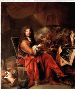
Molier portret autorstwa Nicolas Mignard (1638)