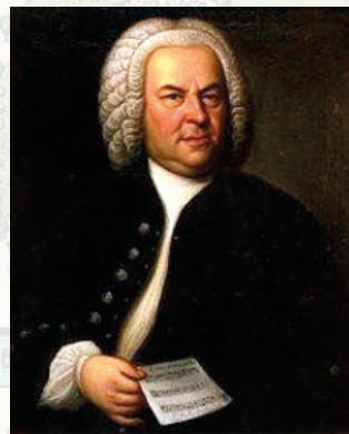
Jan Sebastian Bach (1685-1750)