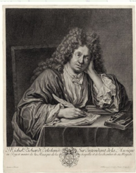
Michel Richard Delalande kompozytor, kierownik muzyczny na dworze Ludwika XIV