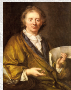
Francois Couperin 1668-1733 kompozytor, klawesynista

Na jego dworze działali tacy giganci sztuki jak: komediopisarz, aktor i dyrektor królewskiego teatru: Molière, dramatopisarz Racine, poeta i krytyk literacki Boileau, bajkopisarz La Fontaine, nadworni muzycy, kompozytorzy i mistrzowie barokowego stylu francuskiego: Lully, Delalande, Charpentier, oraz ordinaire de la musique de la chambre du Roi czyli "członkowie orkiestry królewskiej": Francois Couperin, Marais, Forqueray i inni. Ponadto architekci i dekoratorzy, współtwórcy stylu Ludwika XIV: Le Brun, Le Vau , Mansart, portrecista królewski Hyacinthe Rigaud, teolog, nadworny kaznodzieja i myśliciel polityczny Bossuet, a także bracia Charles Perrault - baśniopisarz oraz Claude Perrault - fizyk i lekarz oraz wielu innych.